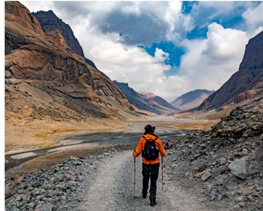
53 Kilometer wandern in drei Tagen scheint machbar. Aber es geht auf 5700 Meter!

und respektiert sich. Das setzt voraus, dass man sich als Tourist zurücknimmt, also nicht herumkrakeelt oder gleich mit der Kamera alles abknipst.