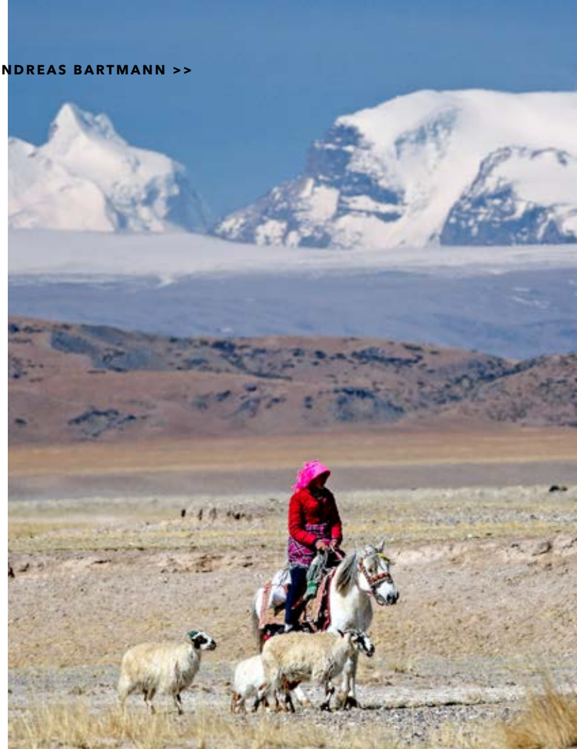
Tibets Hochland: Karge Weiten, majestätische Gipfel, freundliche Menschen.

Konkret ist noch nichts. Aber je älter ich werde, desto mehr wünsche ich mir, auf Reisen das Naturerlebnis mit Begegnungen zu verbinden. Menschen treffen, Kulturen erfahren – und eine tolle Outdoor-Tour. Das ist mein Abenteuer! <<