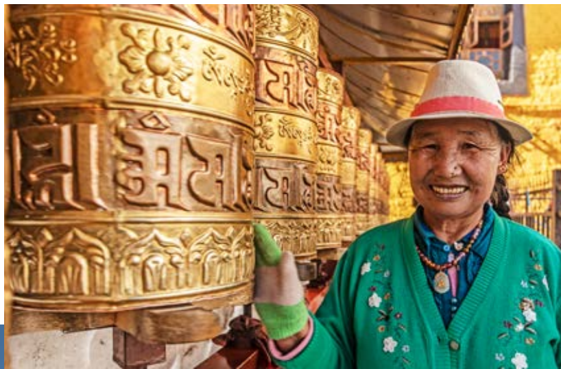
Dem Himmel nahe: Gebetsmühlen in einem Tempel.

Was mich mit am meisten an Tibet fasziniert, ist die Neugier, Offenheit und Gastfreundschaft der Menschen. Das ist auch am Kailash so. Es gibt keinerlei negativen Schwingungen, man lächelt sich an, grüßt